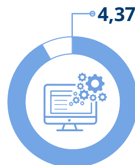
Facilità utilizzo applicativo online Scala valore da 1 a 5