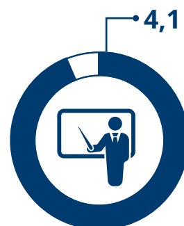
Valutazione docenti Scala valore da 1 a 5

Leggi qui i feedback completi della prima edizione